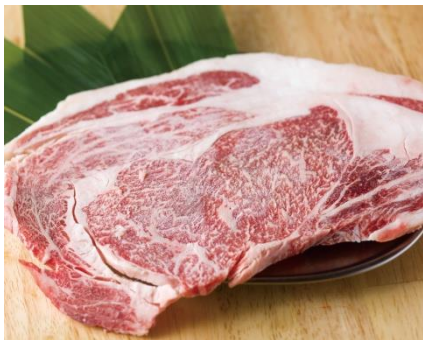
黒毛和牛どでかコース