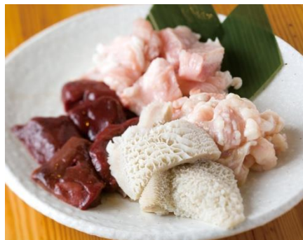
ごちゃまぜ新鮮ホルモン盛