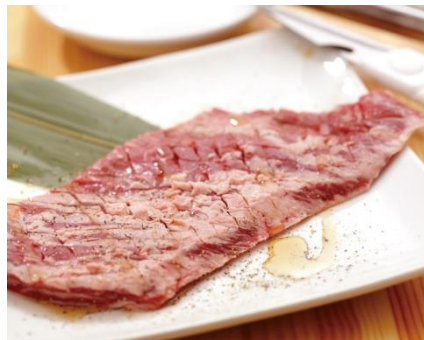
名物ドデカはらみ