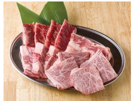
赤身肉オールスター盛