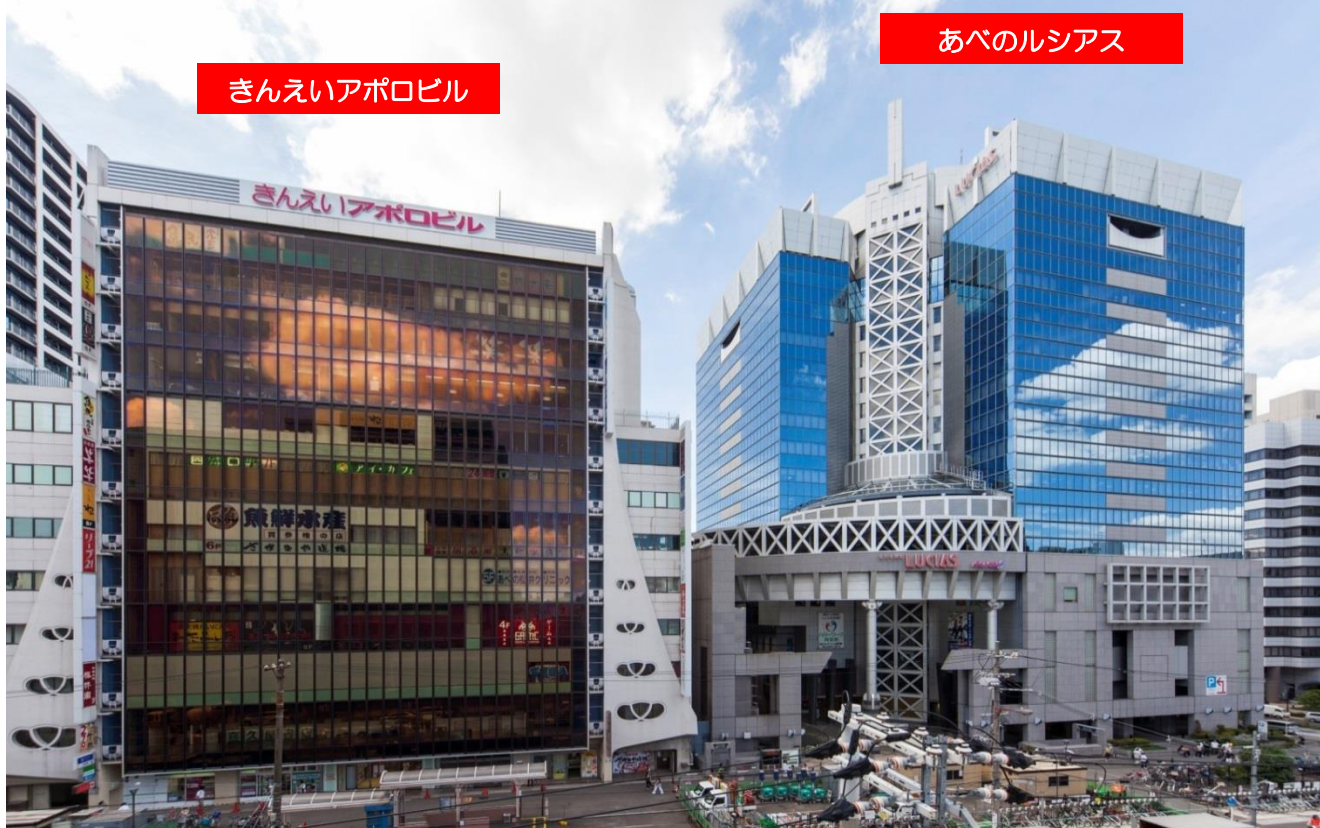
きんえいアポロビル

シネマ、グルメ、ショッピング、サービス、フィットネス、大型書店等約110店舗が揃った大型商業ビル