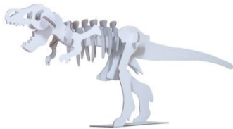
ティラノサウルス

3種類の恐竜ダンボール工作キットのうち1種類を組み立てていただきます。 （参加券1枚で1回参加・先着100名様）