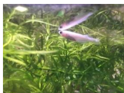
アルバトロス メダカすくい (イメージ)