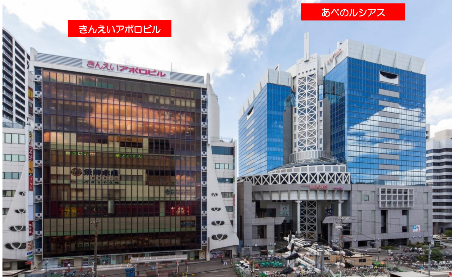
きんえいアポロビル

シネマ、グルメ、ショッピング、サービス、フィットネス、大型書店等約110店舗が揃った大型商業ビル