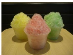
ロッターリアかき氷 (イメージ)