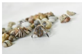
アルバトロス オカヤドカリつり (イメージ)