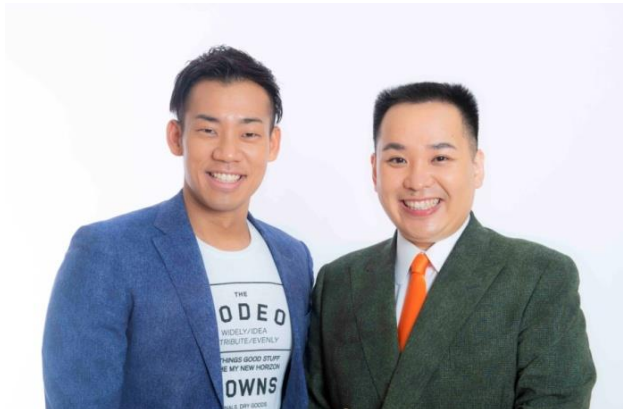
M-1グランプリ2019優勝 ミルクボーイ